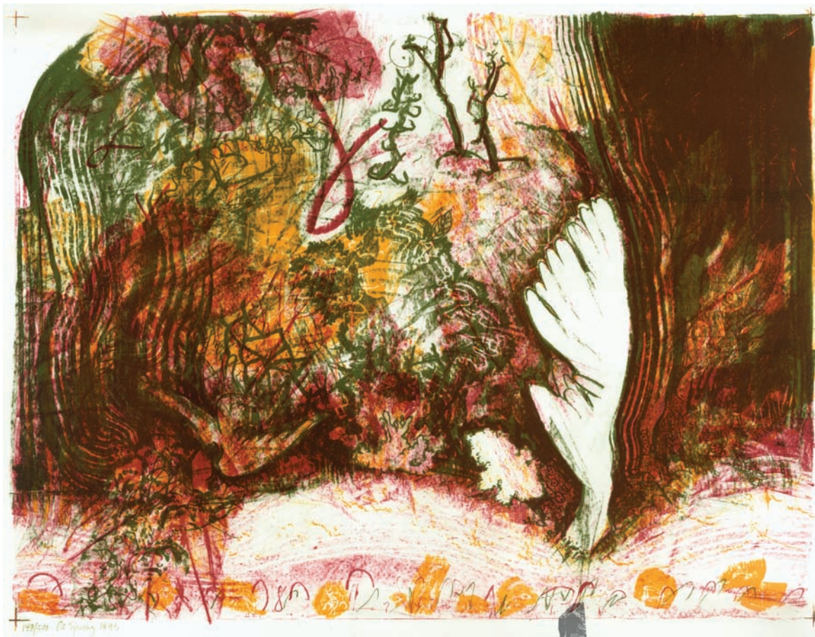
Ole Sparring Litografi fra 1993 Særpris i udstillingsperioden 300 kr.